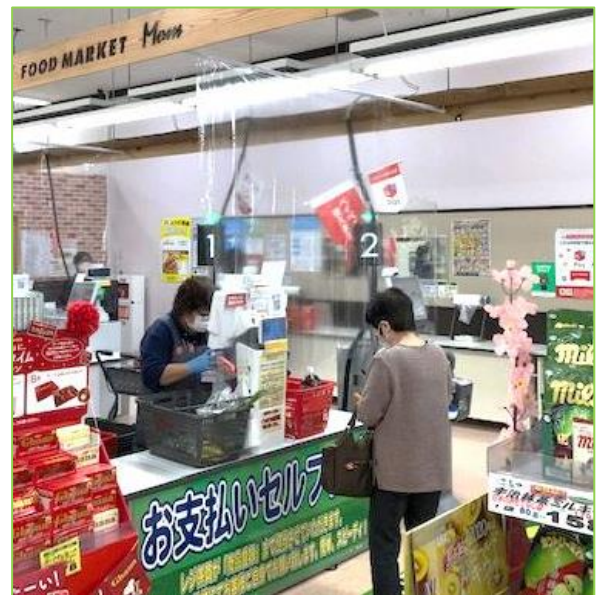
レジ従業員マスク・手袋着用 レジガード設置の様子